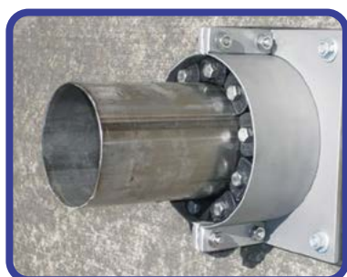
מערכת חוליות לאיטום צינור בודד בשילוב חבק חיצוני