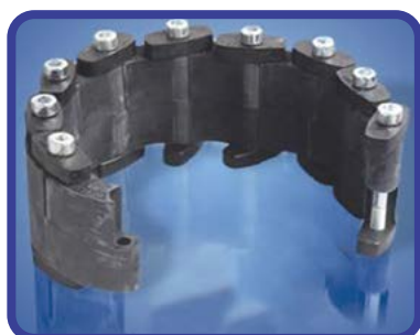
מערכת חוליות לינקסיל - לאיטום צינור בודד החל מקוטר 1 צול