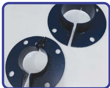
חבק חיצוני לאיטום ע"ג הקיר

מערכות מודולריות דגם RDS לאיטום מעברי צנרת וכבלים עגולים במרחבים מוגנים מאושר פיקוד העורף