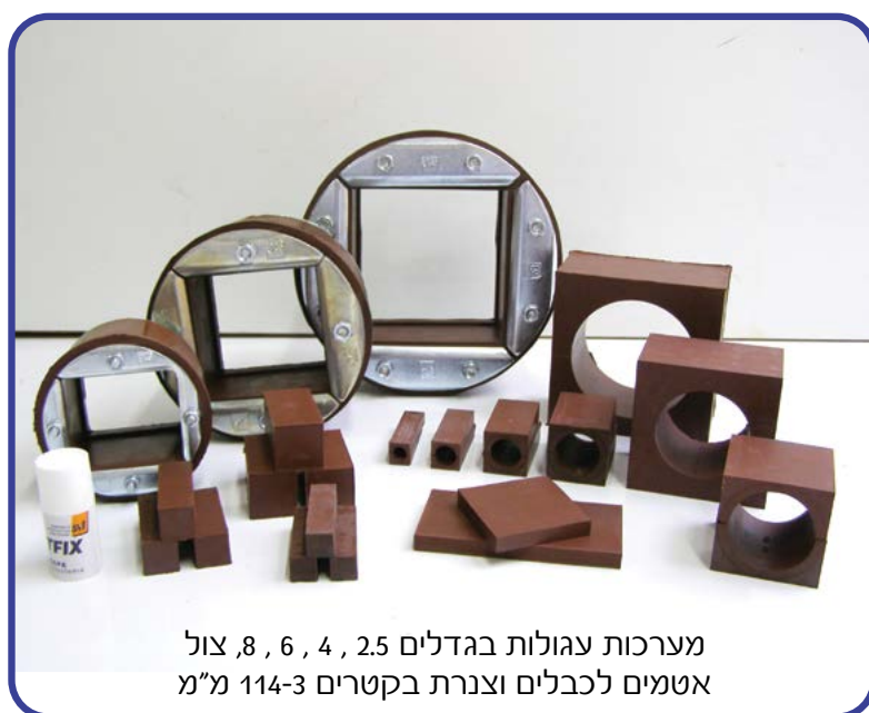
מערכות עגולות בגדלים 2.5, 4, 6, 8, צול אטמים לכבלים וצנרת בקטרים 3-114 מ"מ